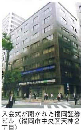
入会式が開かれた福岡証券ビル（福岡市中央区天神2丁目）

入会式、その後の懇親会には地元IPO関係者が数多く参加。入会企業の経営者を激励した