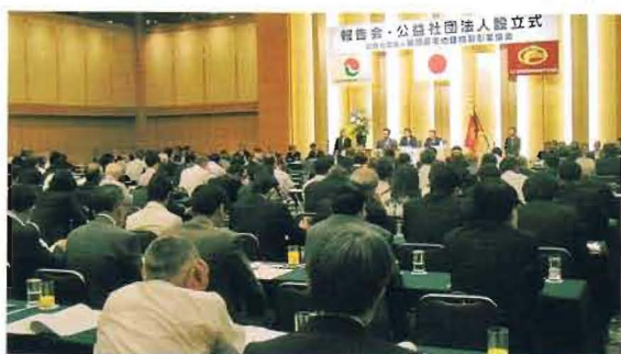
加盟企業からの参加者で埋まった報告会会場