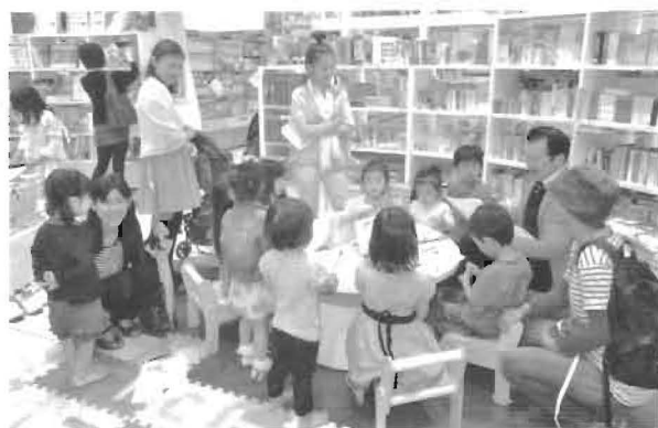
笑顔でイベントを楽しむ参加者

同店は絵本を多数取り揃えるほか、読み聞かせイベントを定期開催するなど幼児向けサービスを強化しており、その一環で